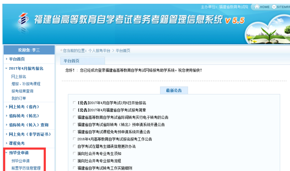
图 2.1.1 选择“预毕业申请”模块进入办理。

注：根据福建省教育考试院关于“高等教育自学考试毕业审核工作的通知”要求，对福建省自学考试毕业审核预申请步骤及确认方式进行调整，考生本人根据系统要求申请提交预毕业专业信息及上传本人近期三个月内白底彩色证件照，并在预申请规定时间内将确认后的相关材料拍照上传系统平台并确认提交预申请，完成毕业申请步骤。