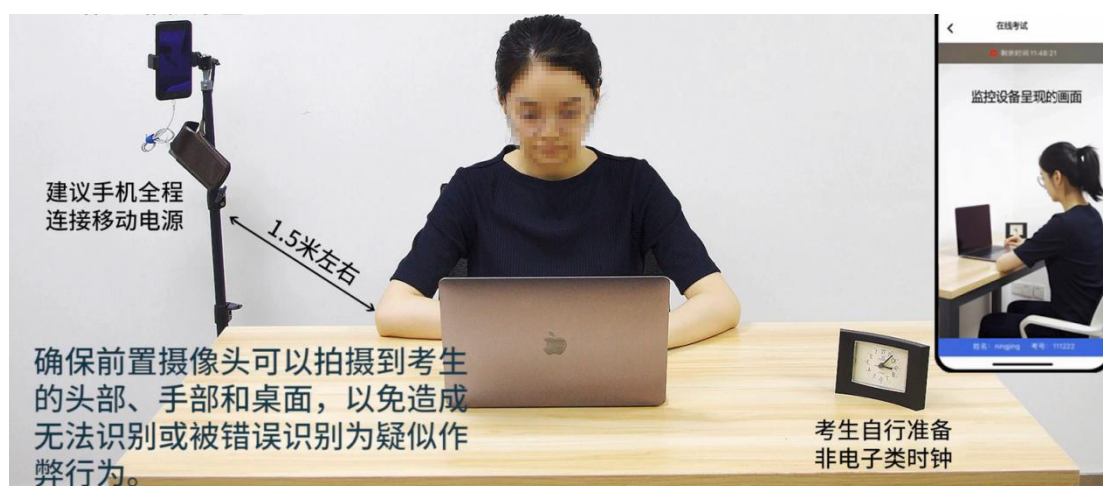
图 5 优巡设备摆放展示