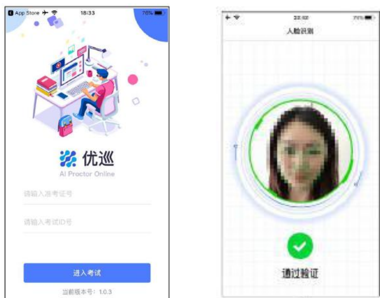
图 4 优巡登录及认证界面