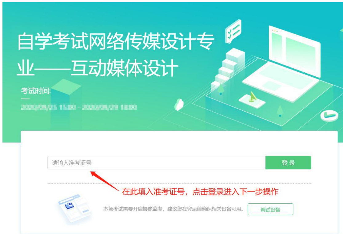
图 2 考试登录界面