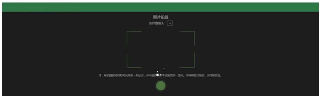
图 3 人脸认证界面