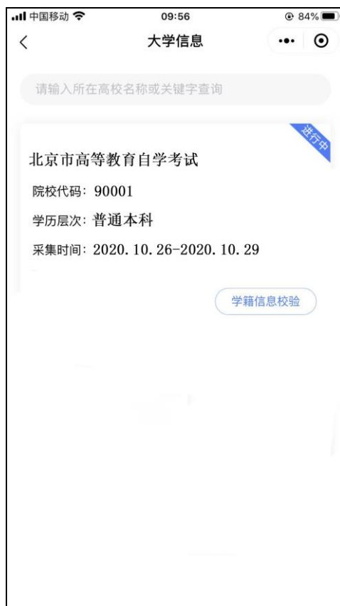
选择相应的学历层次

3. 选择相应的学历层次, 进入校验信息页面, 输入姓名、证件号码并授权微信联系电话